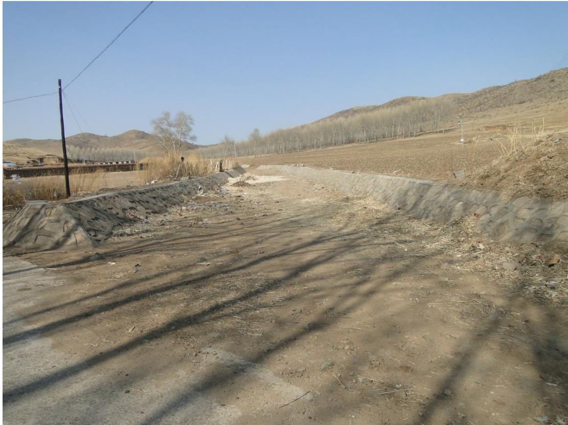
二十四、学田乡河东村北沟（TQ27）