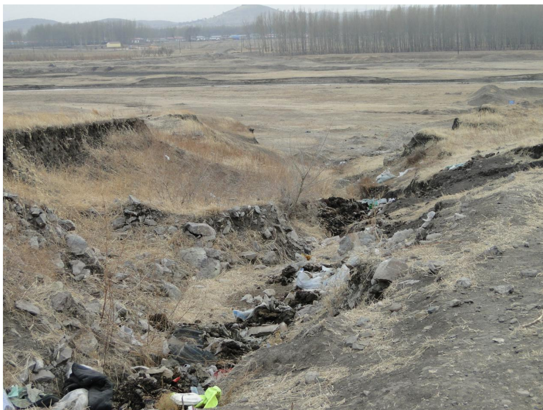
四十、东杜尔基镇光明村屯中间沟（TQ43）