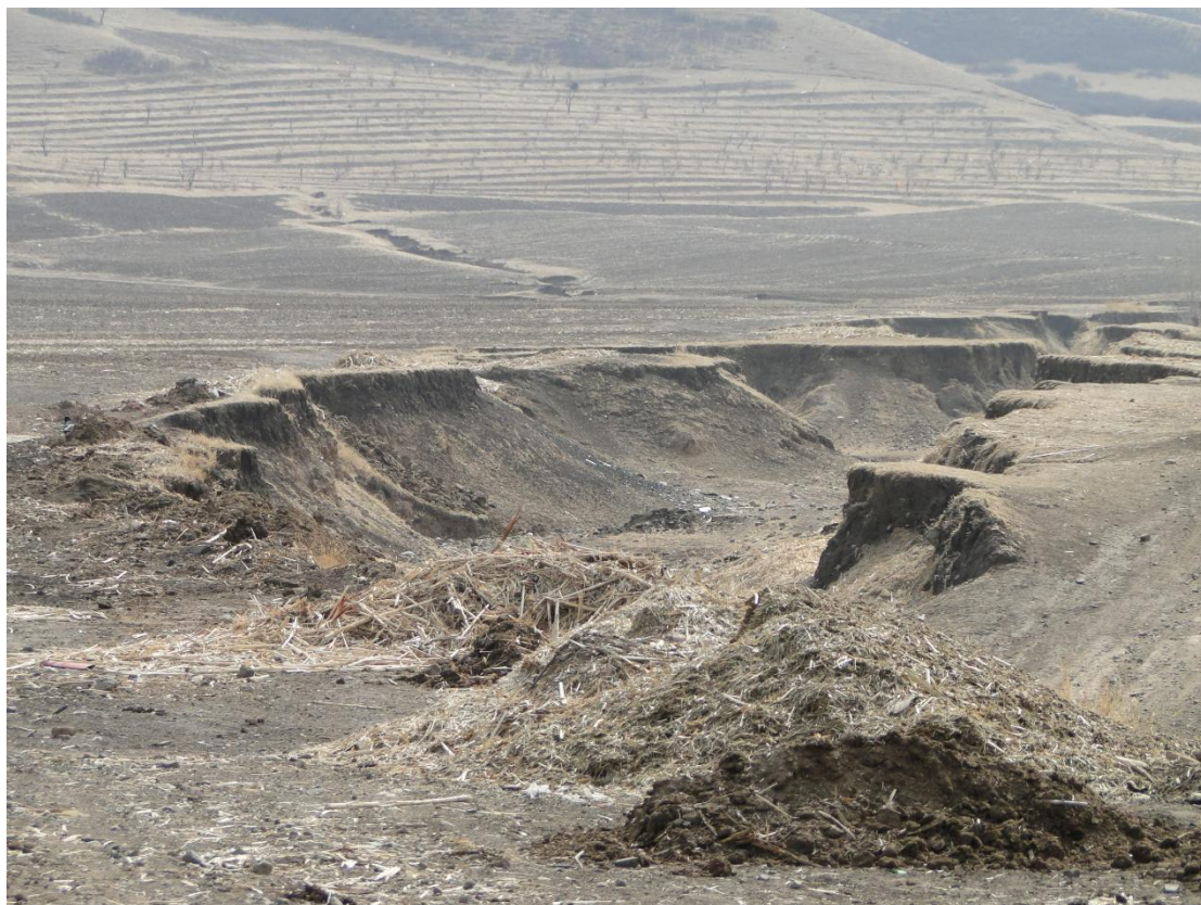
二十八、永安市永巨村巨法屯放蚕沟（TQ31）