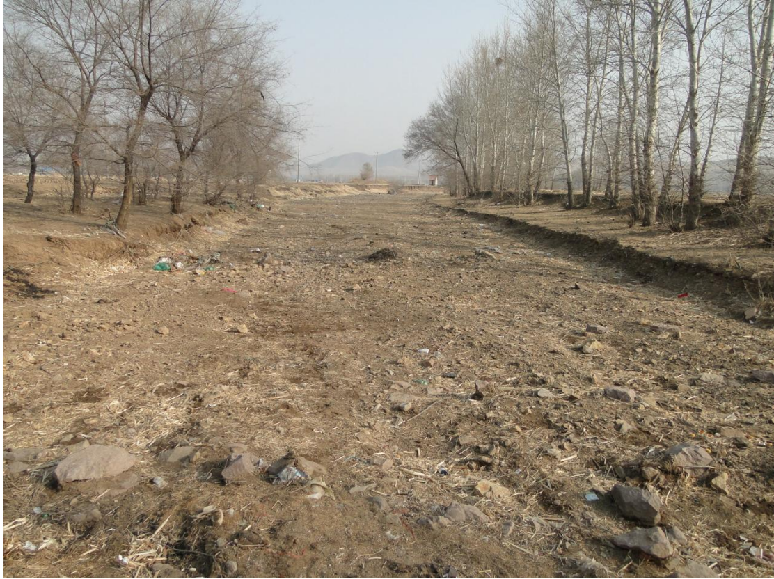
三十二、和安村董家屯东沟（TQ35）