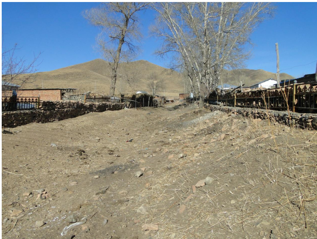
二十、宝石镇宝合村杨家街北沟（TQ23）