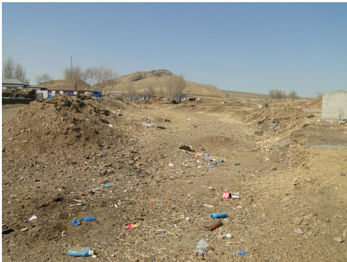
二十六、六户镇兴泉村东山屯南沟（TQ29）