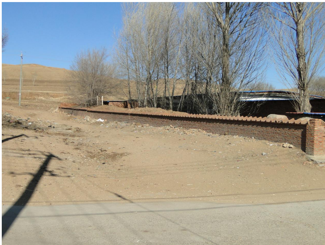
三十、永安市巨有屯南沟（TQ33）