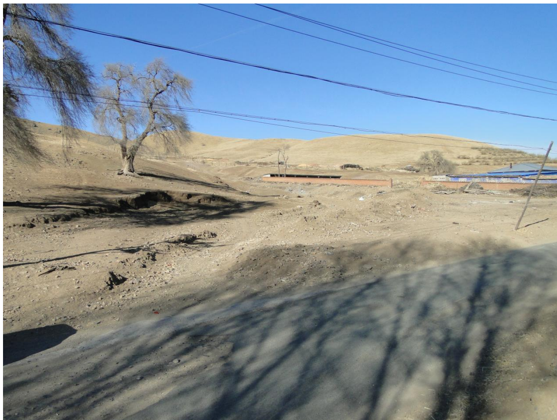
三十六、六户镇巨昌村双合屯东沟（TQ39）